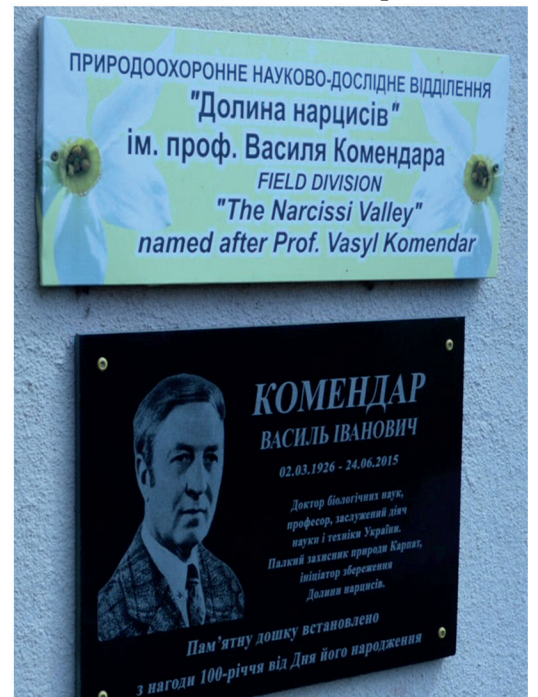
Інститут екології Карпат НАН України

Під час заходів представники наукових установ і природоохоронних організацій обговорили актуальні питання охорони біорізноманіття, поділилися досвідом досліджень та практиками моніторингу рідкісних видів, а також окреслили перспективи подальшої співпраці у сфері збереження природної спадщини Українських Карпат.